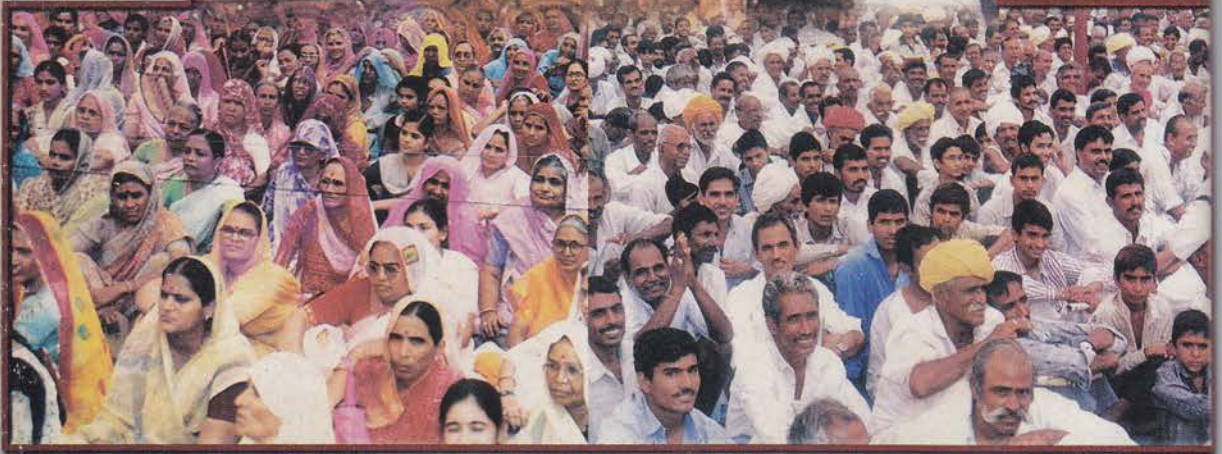
पूज्य बापूजी के पावन सान्निध्य में सत्संग-सुधा का पान करते हुए नागौर (राज.) के भक्तजन ।