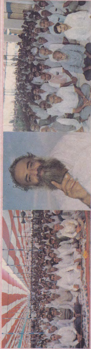
मोडासा (गुजरात) में दिव्य सत्संग समारोह में उपस्थित जनता-जनार्दन...