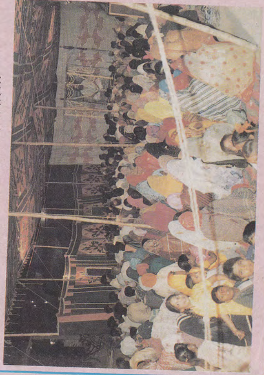
संत श्री आसारामजी सत्संग मंडल, रतलाम द्वारा लकड़पीठा (रतलाम) में आयोजित विशाल सत्संग समारोह...