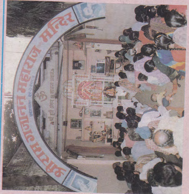
देवास में श्रीराम गजानन महाराज मंदिर में नियमित रूप से चलता हुआ विडियो सत्संग...