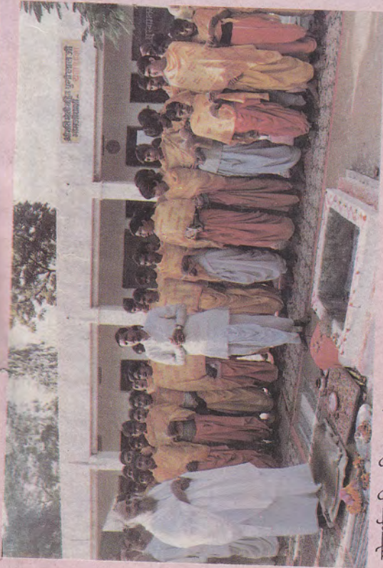
गोवर्धन विद्याविहार संस्कृत पाठशाला (खड़गदा, जि. इंदूरपुर) के आचार्य एवं विद्यार्थियों द्वारा पूज्यश्री का बहुमान... वैदिक मंत्रों से स्वागत सकार...