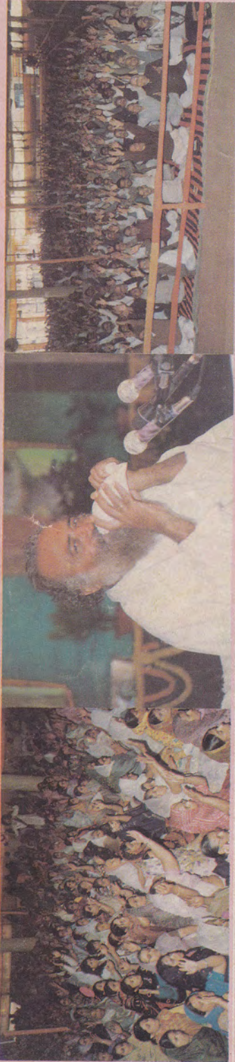
गौहाटी (आसाम) में धर्मधुरंधर पूज्य बापू का शंखनाद एवं उसमें उत्साहपूर्वक सुर मिलाते हुए नौ प्रांत के श्रद्धालु जन...