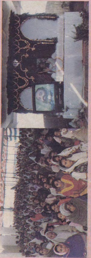
राजकोट (गुजरात) के आश्रम में विडियो सत्संग केन्द्र के उद्घाटन प्रसंग पर साधकों, भक्तों का विशाल जन-समूह...