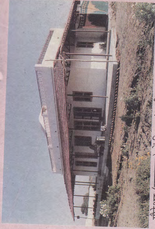
गौरेश्वर (सागवाड़ा) में स्थित संत श्री आसारामजी आश्रम की शान्तिकुटीर...