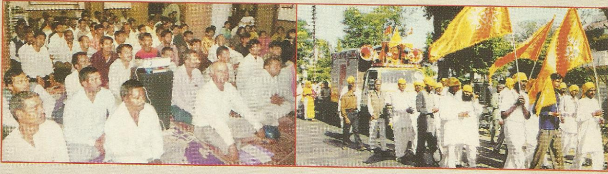
दुबई (यूएई) में 'व्यसनमुक्ति अभियान' के अंतर्गत विडियो सत्संग तथा बुरहानपुर (म.प्र.) से सूरत आश्रम (गुज.) तक (अंतर : ४१२ कि.मी.) पदयात्रा।