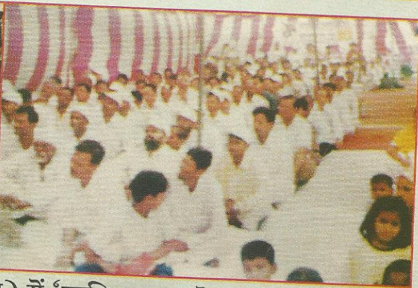
नासिक (महा.) एवं लुधियाना (पंजाब) में 'ऋषि प्रसाद स्नेह सम्मेलन' ।