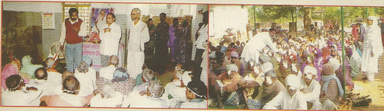
मलाजखंड जि. बालाघाट (म.प्र.) तथा बैकुण्ठपुर (छ.ग.) में निःशुल्क नेत्र चिकित्सा शिविर।