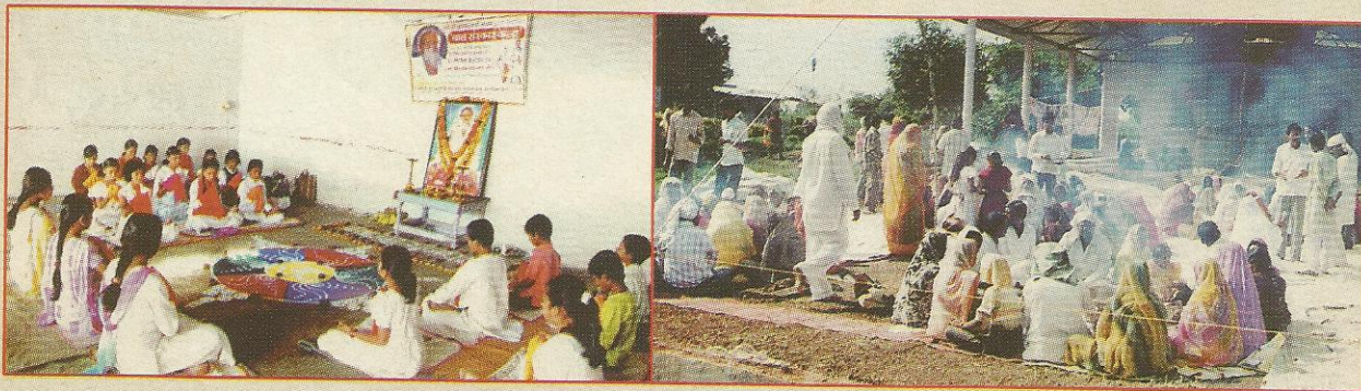
देगलूर जि. नांदेड़ (महा.) में 'बाल संस्कार' केन्द्र द्वारा महामृत्युंजय मंत्र अनुष्ठान तथा हरदा आश्रम (म.प्र.) में सामूहिक हवन।