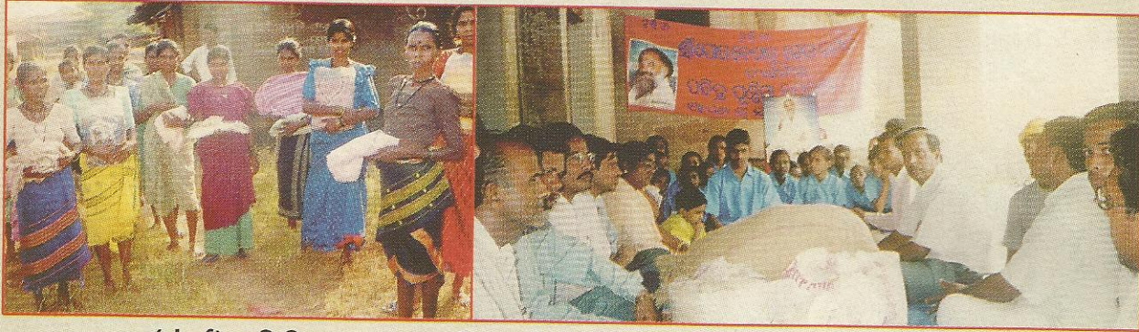
भाण्डुप (मुंबई) समिति द्वारा जवहार जि. थाने (महा.) क्षेत्र में भोजन, वस्त्र, मिठाई वितरण तथा बलांगीर (उड़ीसा) समिति द्वारा तरमा गाँव के मूक-बधिर बच्चों में अनाज-वितरण।