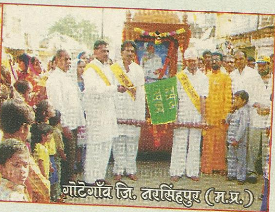
गोटेगाँव जि. बरसिंहपुर (म.प्र.)