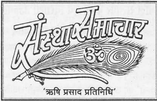
'ऋषि प्रसाद प्रतिनिधि'

२९ अक्टूबर को दशहरे के दिन पूज्यश्री सीकर (राज.) पहुँचे। स्थानीय श्री रामलीला मैदान के श्री रामलीला मंच पर एक शाम राम के नाम हुई।