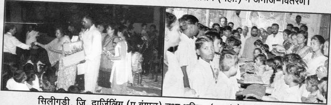
सिलीगुड़ी, जि. दार्जिलिंग (प.बंगाल) तथा धुलिया (महा.) के गरीब बालकों में कपड़े, मिठाई, सत्साहित्य व जीवनोपयोगी वस्तुओं का वितरण।