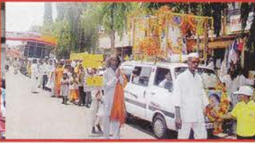
चाकूर, जि. लातूर (महा.)