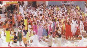
तेल्हारा, जि. अकोला (महा.)