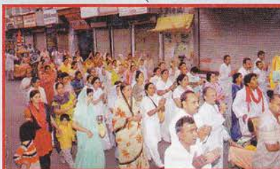
जगाधरी, जि. यमुनानगर (हरियाणा)