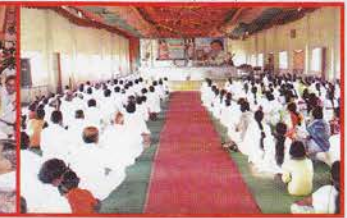
उदगीर, जि. लातूर (महा.)