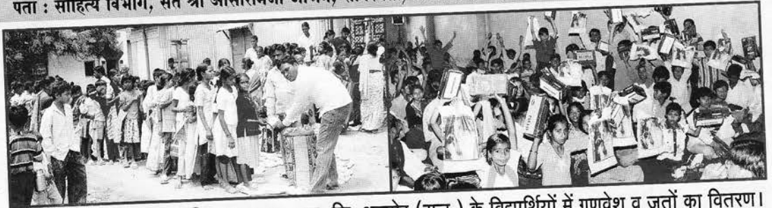
सोलापुर (महा.) में अन्न-वितरण तथा ब्यावर, जि. अजमेर (राज.) के विद्यार्थियों में गणवेश व जूतों का वितरण।