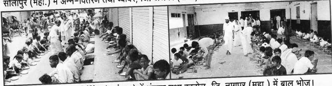
सिलीगुड़ी, जि. दार्जिलिंग (प.बंगाल) में भंडारा तथा काटोल, जि. नागपुर (महा.) में बाल भोज।

Posting at PSO / Ahmedabad between 25 th of preceding month to 10 th of current month. * Posting at ND, PSO on 5 th & 6 th of E.M. * Posting at MBI Patrika Channel on 9 th & 10 th of E.M.