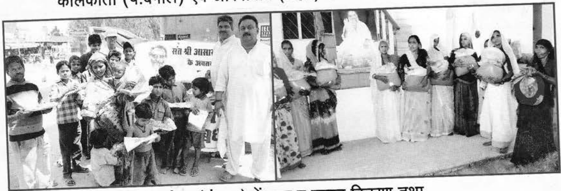
जालंधर (पंजाब) में वस्त्र व प्रसाद वितरण तथा भरतपुर (राज.) में अन्न-वितरण।