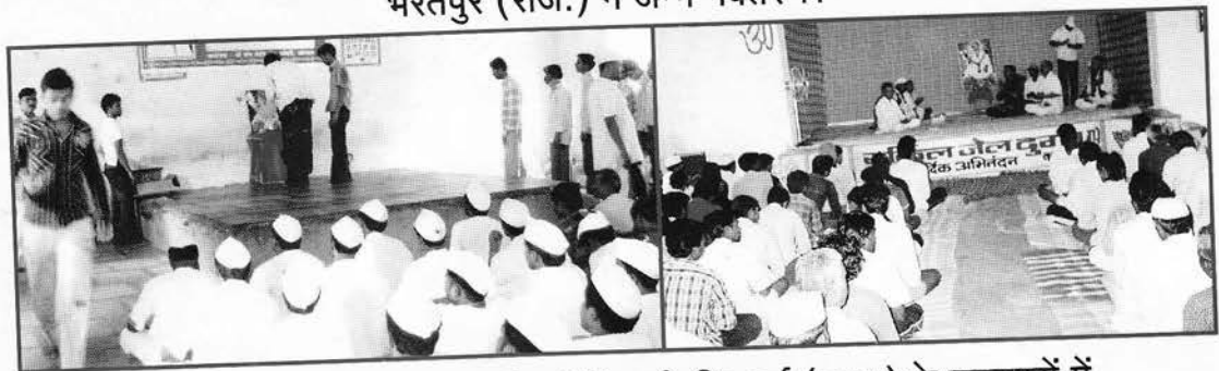
अलिबाग, जि. रायगढ़ (महा.) एवं भिलाई, जि. दुर्ग (छ.ग.) के कारागृहों में भजन, कीर्तन, सत्संग आदि का आयोजन हुआ।