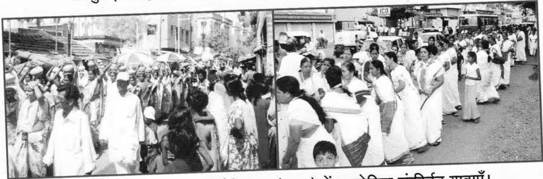
कोलकाता (प.बंगाल) एवं औरंगाबाद (महा.) में आयोजित संकीर्तन यात्राएँ।