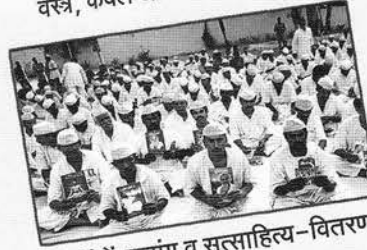
जेलों में सत्संग व सत्साहित्य-वितरण