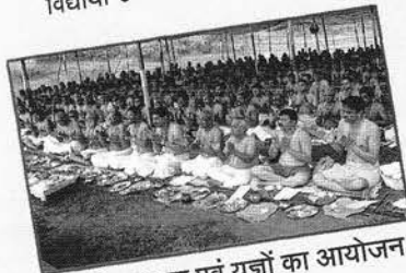
सामूहिक श्राद्ध एवं यज्ञों का आयोजन