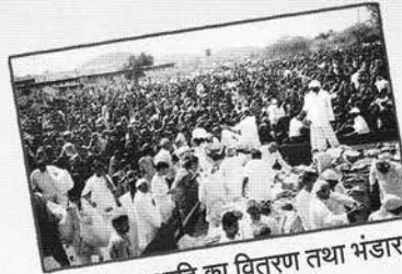
वरत्र, कंबल आदि का वितरण तथा भंडारा