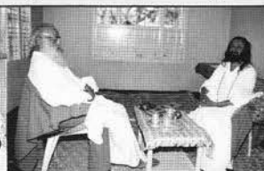
श्री श्री रविशंकरजी महाराज