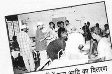
अस्पतालों में फल आदि का वितरण