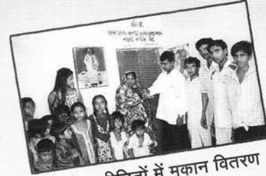
भूकंप-पीड़ितों में मकान वितरण