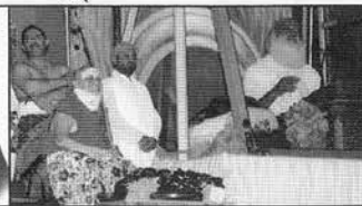
काँची कामकोटि पीठ के जगद्गुरु श्री शंकराचार्यजी