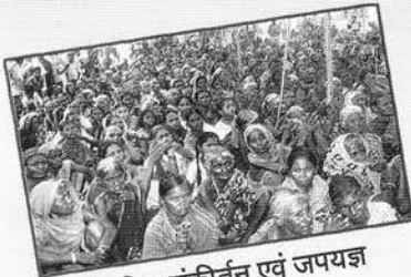
सामूहिक संकीर्तन एवं जपयज्ञ