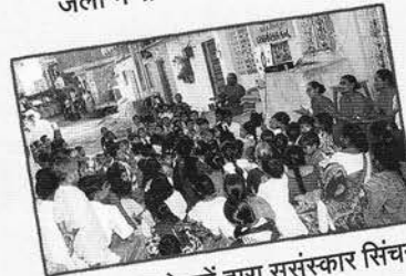
बाल संस्कार केन्द्रों द्वारा सुसंस्कार सिंचन