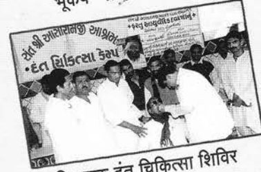
निःशुल्क दंत चिकित्सा शिविर