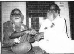
ब्रह्मलीन श्री पथिकजी महाराज