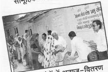
जरूरतमंदों में अनाज-वितरण