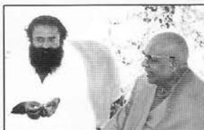
ब्रह्मलीन स्वामी श्री अखंडानंदजी सरस्वती