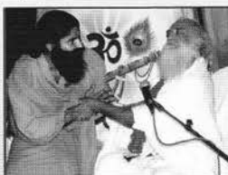
प्रसिद्ध योगाचार्य श्री रामदेव बाबाजी