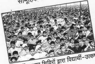
विद्यार्थी उत्थान शिविरों द्वारा विद्यार्थी-उत्कर्ष