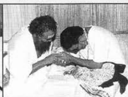
प्रसिद्ध कथाकार श्री मोरारी बापू