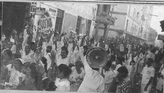
प्रभातफेरी घूमती फिरती अपने मोहल्ले में आती है तब घर-घर में से बालिकाएँ तथा महिलाएँ पूज्य गुरुदेव की आरती उतारने के लिए अपनी अपनी पूजा की थाली सजाकर निकल पड़ती हैं । (उधना में)