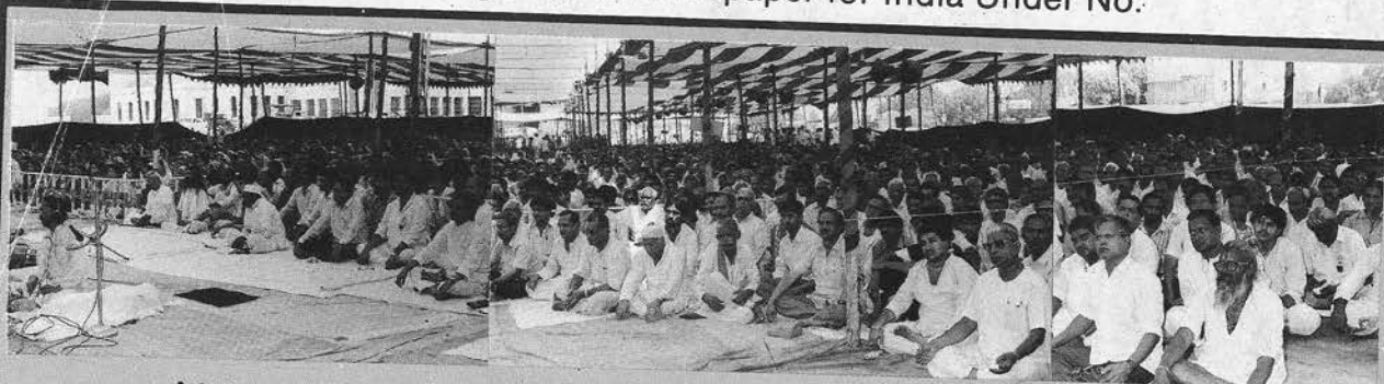
हाडौती क्षेत्र, चर्मण्यवती नगरी, कोटा में पूज्य गुरुदेव की पावन अमृतवाणी की वर्षा में अभूतपूर्व विराट जनमेदनी...