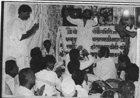
गाँव-गाँव और घर-घर में सत्संग... विडियो सत्संग में तन्मय साधक गण... । (प्रतापगढ़)