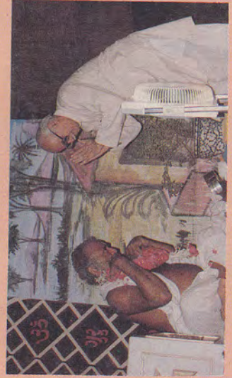
अहमदाबाद आश्रम में, दि. १-०-९३ की शाम को भा.ज.पा. के प्रमुख श्री एल. के. अडवाणी पूज्यश्री के दर्शन-सत्संग से ध्यतता महसूस करके स्नेहपूर्वक वन्दना करते हुए...