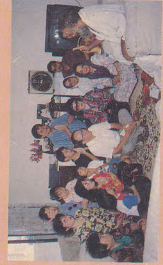
सिंगापुर एयरलाइन्स के जनरल मैनेजर एवं उनका परिवार पूज्य श्री गुरुदेव के आशीर्वाद प्राप्त करते हुए...