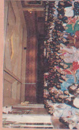
सिंगापुर में शंखनाद से गीता-ज्ञानयज्ञ का शुभारंभ करते हुए पूज्यश्री...