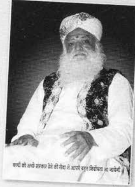
कर्मों को अच्छे संस्कार देने ही तब नरें आपने बरुन मिलेपत हो करेवेरी

गुरुपूर्णिमा २०१० तक यह अभियान जारी है। जिसमें नया बाल संस्कार केन्द्र पंजीकरण करवाने पर पूज्यश्री का यह मनोहर श्रीचित्र तथा प्रचार सामग्री भी प्रसाद रूप में भेजी जायेगी। - बाल संस्कार मुख्यालय, अहमदाबाद