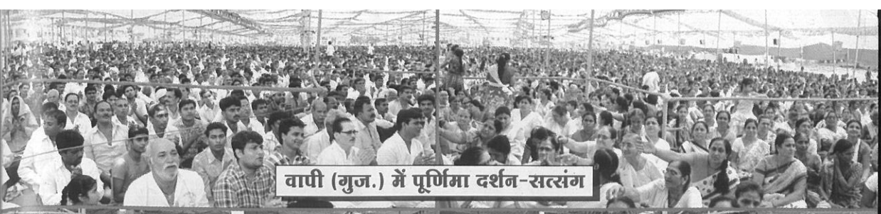
वापी (गुज.) में पूर्णिमा दर्शन-सत्संग

को ना पथ के ग- धैव रते व दी जन ल, गी नेवा के जन रण प न रण जवे पर नल नण ज्य को बत न रूप □ ग ७० ४२ ७४ ४६