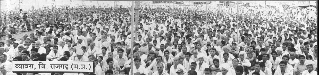
ब्यावरा, जि. राजगढ़ (म.प्र.)