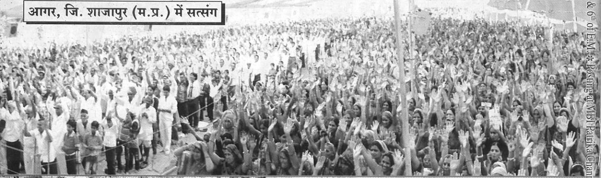
आगर, जि. शाजापुर (म.प्र.) में सत्संग