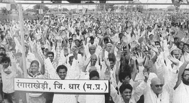
संगाराखेड़ी, जि. धार (म.प्र.)