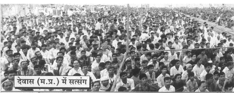
देवास (म.प्र.) में सत्संग

Posting at Dehradun, G.P.O. between 1st of every month & Posting at N.D. P.S.O. on 5 th & 6 th of E.M. & Posting at MBI Patlika Channel on 9 th & 10 th of E.M.