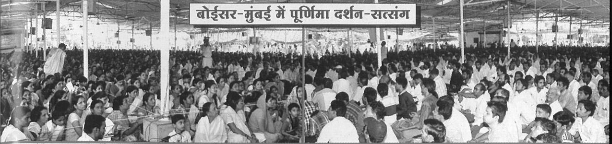
बोईसर-मुंबई में पूर्णिमा दर्शन-सत्संग