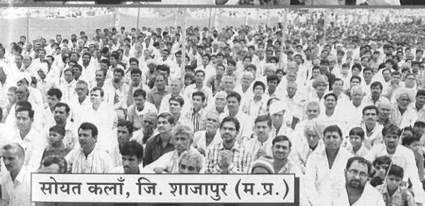
सोयत कलाँ, जि. शाजापुर (म.प्र.)