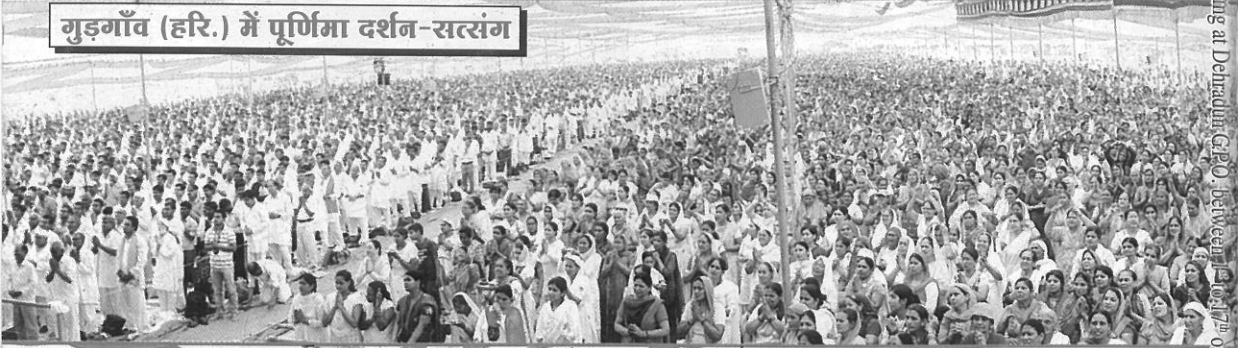
गुड़गाँव (हरि.) में पूर्णिमा दर्शन-सत्संग