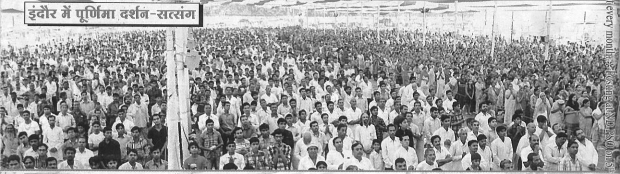
इंदौर में पूर्णिमा दर्शन-सत्संग