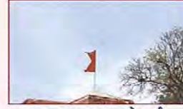
जप, पाठ, हवन से पूर्व