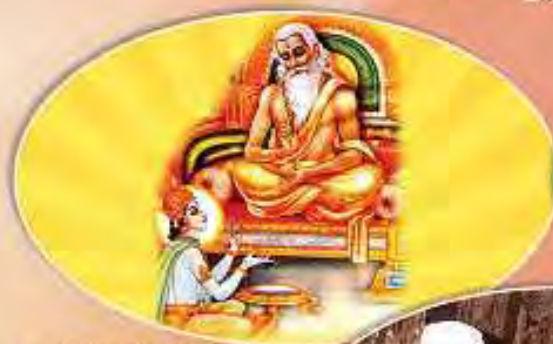
गुरु वसिष्ठजी महाराज के श्रीचरणों में भगवान श्रीराम