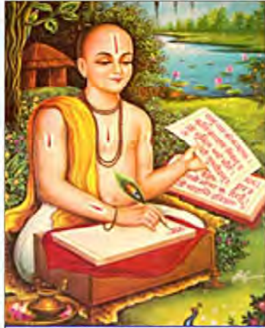
संत तुलसीदासजी जयंती : १३ अगस्त

संत तुलसीदासजी काशी में प्रवचन करते थे। दूर-दूर तक उनकी ख्याति फैल चुकी थी। कहते हैं जहाँ