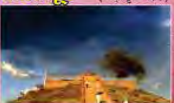
पूर्णाहुति के समय आसमान में छाये बादल