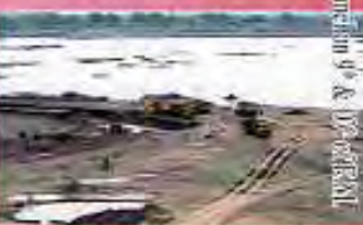
अकाल बदला सुकाल में

दिव्य प्रेरणा-प्रकाश ज्ञान प्रतियोगिता-२०१३ शुरू हो रही है, समितियाँ व साधक अपने-अपने क्षेत्र में प्रतियोगिता के आयोजन का दैवी सेवाकार्य शुरू कर सकते हैं।