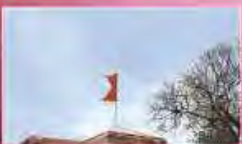
जप, पाठ, हवन से पूर्व