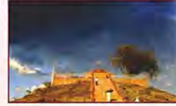
पूर्णाहुति के समय आसमान में छाये बादल