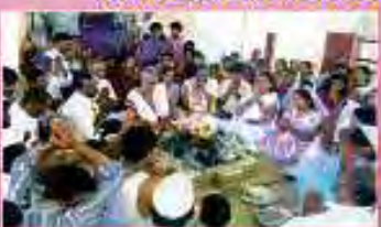
हवन, जप, पाठ करते हुए