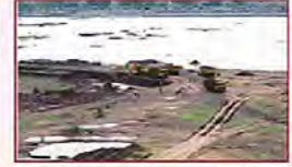
अकाल बदला सुकाल में

मार्च माह में ऐरोली (मुंबई) में आयोजित होली कार्यक्रम के दौरान मीडिया ने पूज्य बापूजी के लिए अनर्गल प्रलाप अलापा । इससे हमको बड़ा दुःख हुआ । मंत्र-विज्ञान के लिए कुछ चैनलों ने जो चुनौती दी, उसे हम सब साधकों ने स्वीकार कर लिया । सातारा जिले (महा.) में खटाव तहसील पिछले दो सालों से सूखाग्रस्त है । यहाँ भयंकर अकाल के कारण लोगों को तथा जानवरों को पीने के लिए पानी नहीं था । टैंकर से पानी आता था । पुसेगाँव के पास एक बड़ा तालाब है - ‘नेर’ । उसमें बड़ी-बड़ी दरारें पड़ गयी थीं । यहाँ के ४००-५०० साधकों ने मिलकर पंडाल लगवाया और २४ से २६ मई तक त्रिकाल संध्या में श्री आशारामायण पाठ, गुरुमंत्र का जप, सत्संग व हवन किया ।