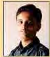
भौतिक सवालिया राजकोट, P.R. ९७.२८

मध्य प्रदेश बोर्ड : छिंदवाड़ा गुरुकुल की १०वीं की परीक्षा का १००% परिणाम तथा ८६.२५% विद्यार्थी प्रथम श्रेणी में उत्तीर्ण एवं गणित विषय में ४ विद्यार्थियों के १००/१०० तथा ५ विद्यार्थियों के ९९/१०० अंक।