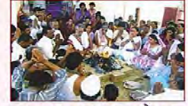
हवन, जप, पाठ करते हुए