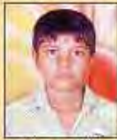
कोचरा उदयसिंह सरकी लीमड़ी, P.R. ९८.८