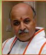
डॉ. प्रवीण तोगड़िया