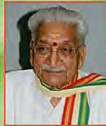
श्री अशोक सिंहल