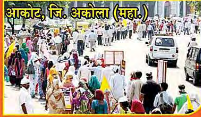
आकोट, जि. अगोला (महा.)