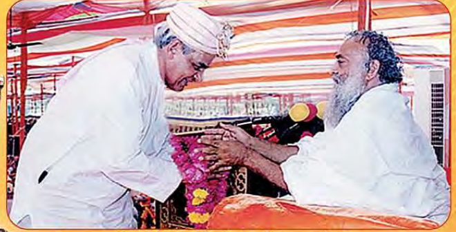
श्री अटल बिहारी वाजपेयी (पूर्व प्रधानमंत्री) पूज्य बापूजी से आशीर्वाद प्राप्त करते हुए

मूल्य : ₹ ६ प्रकाशन दिनांक : १ अक्टूबर २०१३ वर्ष : २३ अंक : ४ (निरंतर अंक : २५०)