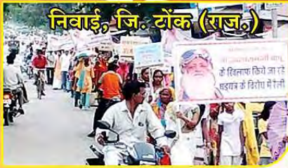
निबार्ड, जि. डोंक (राज.)