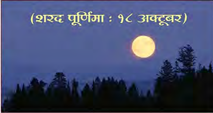
(शरद पूर्णिमा : १८ अक्टूबर)

* तुलसी के १०-१२ पत्ते एक कटोरी पानी में भिगोकर चाँदनी रात में २-३ घंटे के लिए रख दें। फिर इन पत्तों को चबाकर खा लें व थोड़ा पानी पियें। बचे हुए पानी को छानकर एक-एक बूँद आँखों में डालें, नाभि में मलें तथा पैरों के तलुओं पर भी मलें। आँखों से धुँधला दिखना, बार-बार पानी आना आदि में इससे लाभ होता है। तुलसी के पानी की बूँदें चन्द्रकिरणों के संग मिलकर प्राकृतिक अमृत बन जाती हैं। (दूध व तुलसी के सेवन में दो-ढाई घंटे का अंतर रखें।)