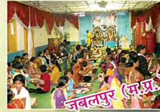
जबलपुर (मध्य प्रदेश)