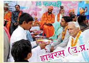
हाथरस (उत्तर प्रदेश)