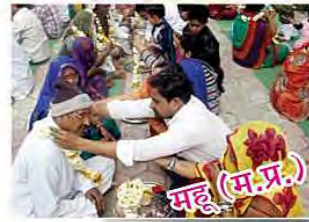
महू (मध्य प्रदेश)