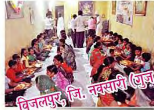
विजलपुर, जि. नवसारी (गुजरात)