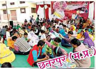
छतरपुर (मध्य प्रदेश)