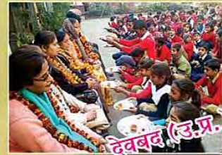
देवबंद (उत्तर प्रदेश)