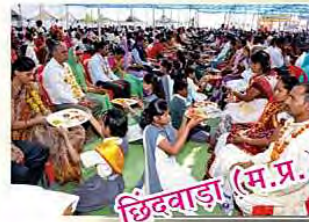
छिदवाड़ा (मध्य प्रदेश)