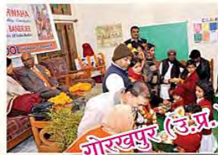
गोरखपुर (उत्तर प्रदेश)