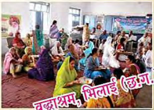
वृद्धाश्रम, भिलाई (छत्तीसगढ़)