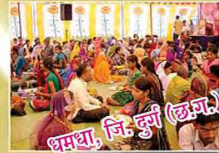
धमधा, जि. दुर्ग (छत्तीसगढ़)