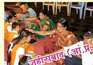
जहीराबाद (आंध्र प्रदेश)

स्थानाभाव के कारण सभी तस्वीरें नहीं दे पा रहे हैं। अन्य अनेक तस्वीरों हेतु वेबसाइट www.ashram.org देखें।