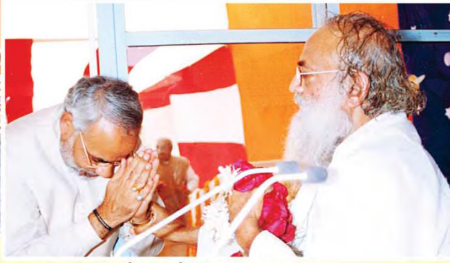
श्री नरेन्द्र मोदी