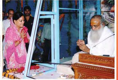
श्रीमती वसुंधरा राजे सिंधिया