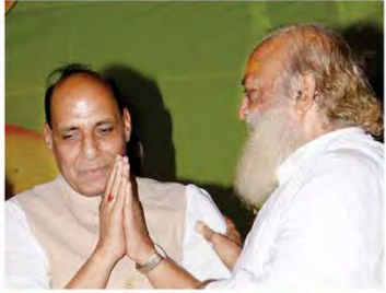
श्री राजनाथ सिंह