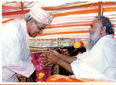
श्री अटल बिहारी वाजपेयी

मूल्य : ₹ ६ भाषा : हिन्दी प्रकाशन दिनांक : १ अक्टूबर २०१४ वर्ष : २४ अंक : ४ (निरंतर अंक : २६२)