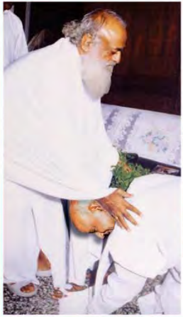
श्री एच.डी. देवेगौड़ा