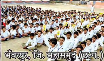
भंवरपुर, जि. महारसुंद (छ.ग.)