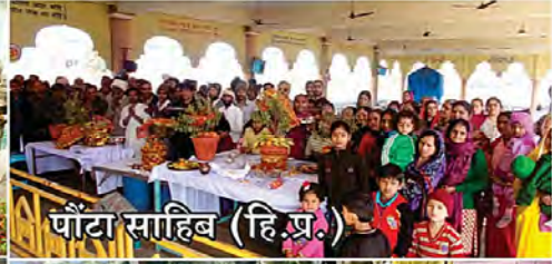
पौटा साहिब (हि.प्र.)