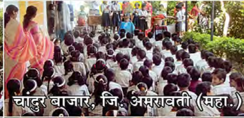
चादुर बाजार, जि. अमरावती (महा.)