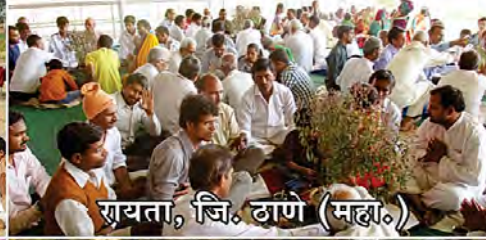
रायता, जि. ठाणे (महा.)