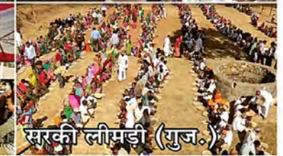
सरकी लीमडी (गुज.)