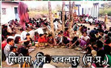
सिहोरा, जि. जबलपुर (म.प्र.)