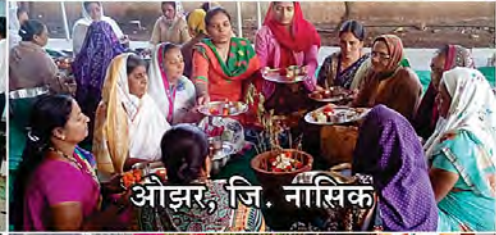
औड़र, जि. नासिक