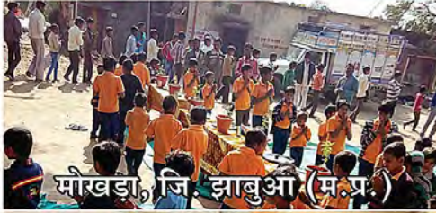
मौखड़ा, जि. झाबुआ (म.प्र.)