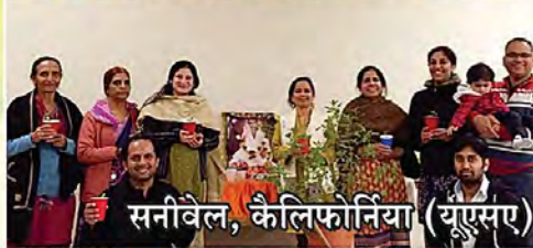
सनीवेल, कैलिफोर्निया (यू.एसए)