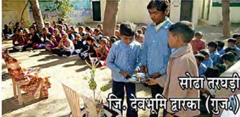
सौदा तरखड़ी जि. देवभूमि द्वारका (गुज.)