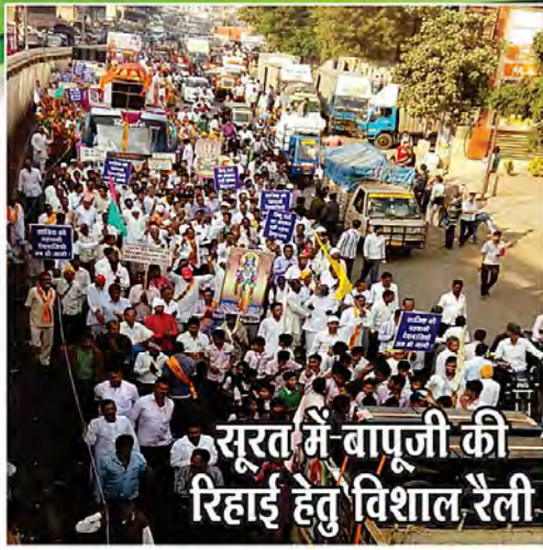
सूरत में बापूजी की रिहाई हेतु विशाल रैली