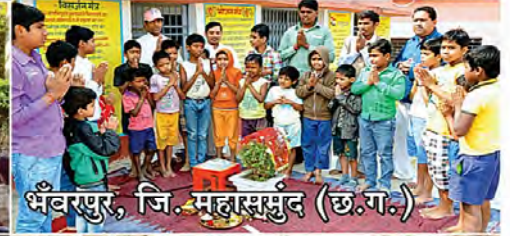
भँवरपुर, जि. महारासुंद (छ.ग.)