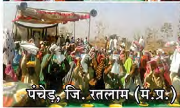
पंचेड, जि. रतलाम (म.प्र.)