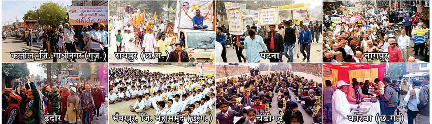
कलोल, जि. गांधीनगर (राज.)