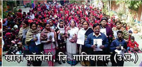
खोड़ा कालोनी, जि. गाजियाबाद (उ.प्र.)