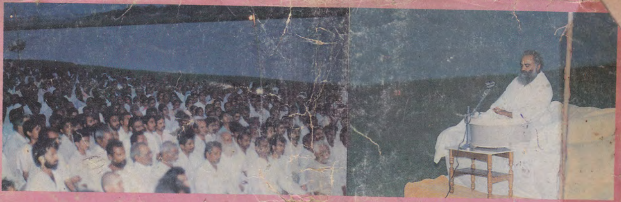
तापी के तीर पर सन्ध्या के आँचल में सत्संग का अमृत बरसे...