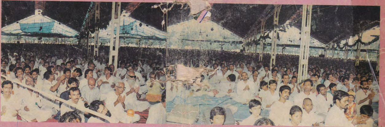
सुरत आश्रम में जन्माष्टमी के उत्सव पर विशाल जनमेदनी... श्रीकृष्णनाम-संकीर्तन में भावविभोर भक्तसमुदाय...