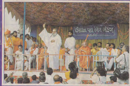
जन्माष्टमी महोत्सव पर राजकोट शहर में निकली डेढ़ कि. मी. लम्बी रथयात्रा को आशीर्वचन एवं विदाई देते हुए।