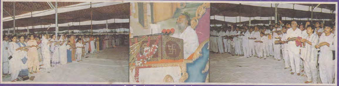
पूज्यश्री की मंगल आरती करते हुए भक्तजन