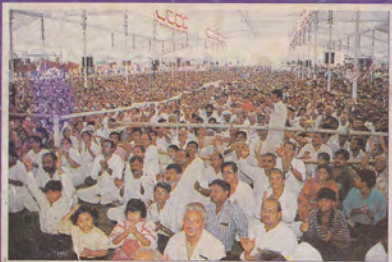
फरीदाबाद में निजानंद की मस्ती में मस्त पूज्य बापूजी के सुप्रवचनों का आचमन करने उमड़ा अपार जनसमूह