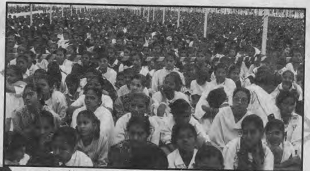
बड़ौदा में आयोजित अविस्मरणीय समारोह में आत्मानुभव को छुकर आनेवाली पूज्यश्री की दिव्य वाणी का आनंद मान करते हुए ४-४ लाख श्रद्धालुजन ।

REGISTERED WITH R.N.I UNDER NO. 48873-91 LICENSED TO POST W/O PRE PAYMENT AHMEDABAD POLICE NO. 207 REGD NO. GAMB.1132 BOMBAY BYCULLA POLICE NO. 1 REGD NO. MUMBAI