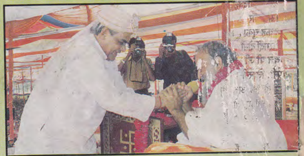
भारतभर में घूम-घूमकर भारतवासियों की असली सेवा करनेवाले भाजपा के वरिष्ठ नेता श्री अटल बिहारी वाजपेयी पूज्यश्री का भावभीना स्वागत करते हुए