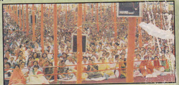
उत्तर प्रदेश के साधक भाई- बहन पूज्यश्री की ज्ञानवर्षा में स्नान करते हुए