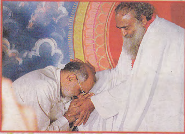
दिल्ली राज्य के मुख्यमंत्री श्री साहिबसिंह वर्मा पूज्यश्री का भावभीना स्वागत करते हुए...