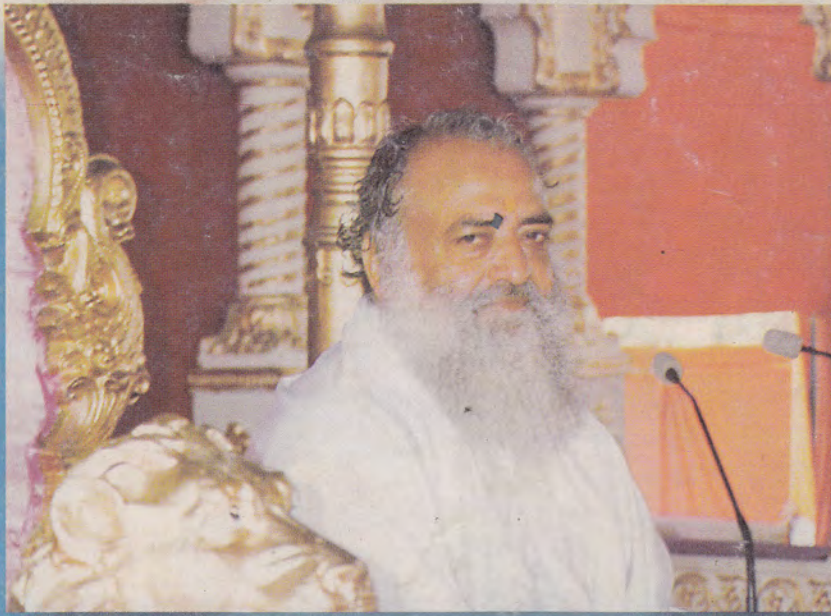
‘संत शरण जो जन पड़े सो जन उधरनहार’