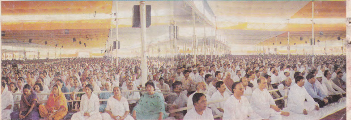
विश्वशांति सत्संग में पूज्यश्री की ज्ञानगंगा में सराबोर मुंबई के भक्तजन ।

REGISTERED WITH R.N.I. UNDER NO. 4887/3/91 LICENSED TO POST. TWO PRE-PAYMENT. AHMEDABAD PSU LICENSE NO. 20 / HEPD NO. GAWC/112. BOMBAY/BC/CO. A PSU LICENSE NO. 1 HEPD. NO. MH/MW/01