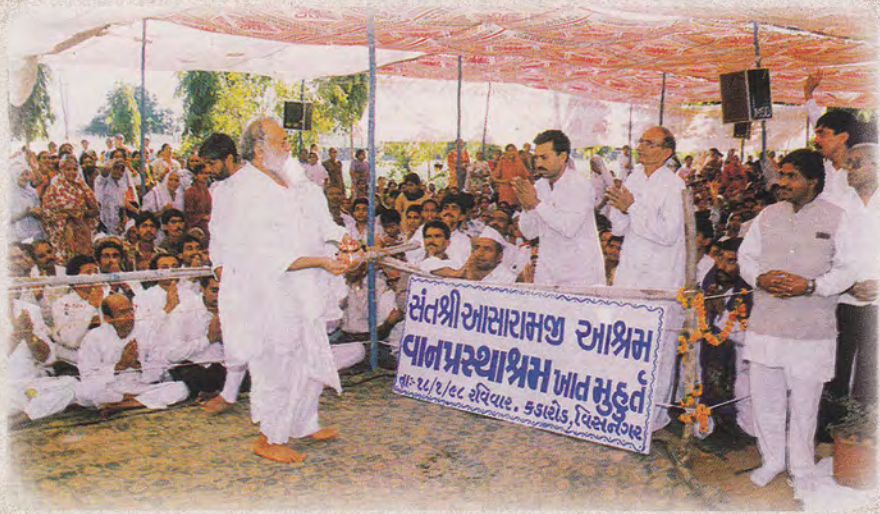
विसनगर (गुज.) में वानप्रस्थाश्रम का भूमिपूजन करते हुए जीवन्मुक्त संत श्री आसारामजी बापू ।