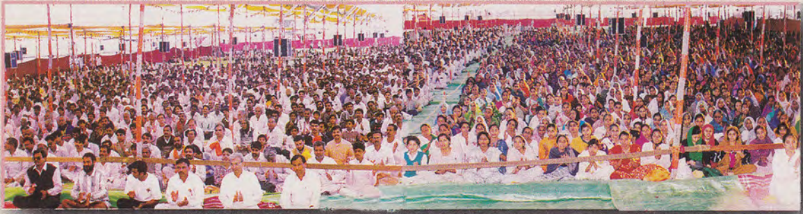
मधुर कीर्तन के आनंद में सराबोर जनसमुह : मोयद (गुज.)