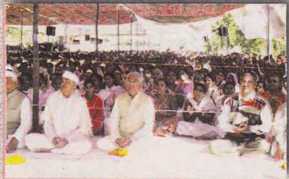
विसनगर (गुज.) में कीर्तन व सत्संग की मस्ती में मस्त साधकवृंद ।