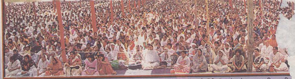
हिमालय को चरणरज से पुनित कर दिया, आध्यात्मिक महक से सुरम्भित कर दिया। भक्तों को निगाहों से प्यालियों पिलाकर, रोम-रोम उनका पुलकित कर दिये हिमालय की बर्फीली चोटियों के बीच बसे नई टिहरी में ऐसा सत्संग-महायज्ञ और ऐसी ऊँचाई पर इतने हजारों हजारों सत्संगी श्रीता... 'न भूतो न भविष्यति