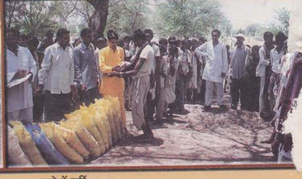
जो मजा खिलाने में है, वह आप खाने में नहीं...

गोधरा (गुज.) के अकालग्रस्त इलाकों में हररोज २५००० से भी अधिक अकाल पीड़ितों की राहत सेवाकार्य में रत संत श्री आसारामजी आश्रम के साधकगण ।