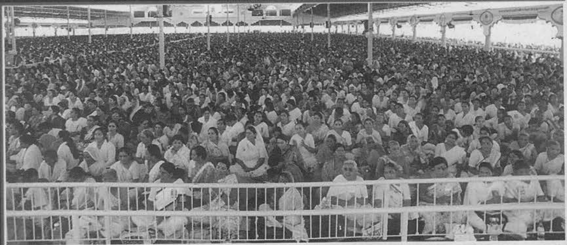
जन्माष्टमी का शुभ अवसर आया, हर साधक का मन हर्षाया । दर्शन, सत्संग, माखन देकर गुरुवर ने अमृत बरसाया ॥ सूरत आश्रम में पूज्यश्री की अमृतवाणी का मंत्रमुग्ध होकर रसपान कर रहे लाखों-लाखों श्रोतागण ।

ED TO POST WITHOUT THE 9th & 10th OF EVERY MONTH BEING FROM DELHI TO NO. 20/ 47 30