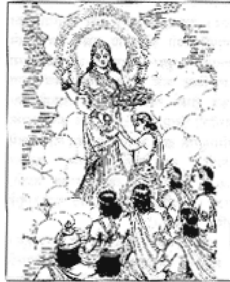
देवताओंकी यह व्याकुल प्रार्थना

देवताओंने कहा—महामाये ! अपनी सारी प्रजाकी रक्षा करो, रक्षा करो। अपने क्रोधको रोको, अन्यथा सब लोग निश्चय ही नष्ट हो जायेंगे। कृपासिन्धो ! दीनबन्धो ! जैसे शुम्भ नामक दैत्य, महाबली निशुम्भ, धूम्राक्ष, चण्ड, मुण्ड, महान् शक्तिशाली रक्तबीज, मधु, कैटभ तथा महिषासुरका तुमने वध किया था, उसी प्रकार इस दुर्गमासुरका शीघ्र ही संहार करो। बालकोंसे पग-पगपर अपराध बनता ही रहता है। केवल माताके सिवा संसारमें दूसरा कौन है, जो उस अपराधको सहन करता हो। देवताओं और ब्राह्मणोंपर जघ-जघ दुःख आता है, तब-तब दोग्र ही अवतार लेकर तुम सब लोगोंको सुखी बनाती हो।