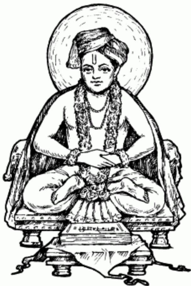
संत जानेश्वर महाराज